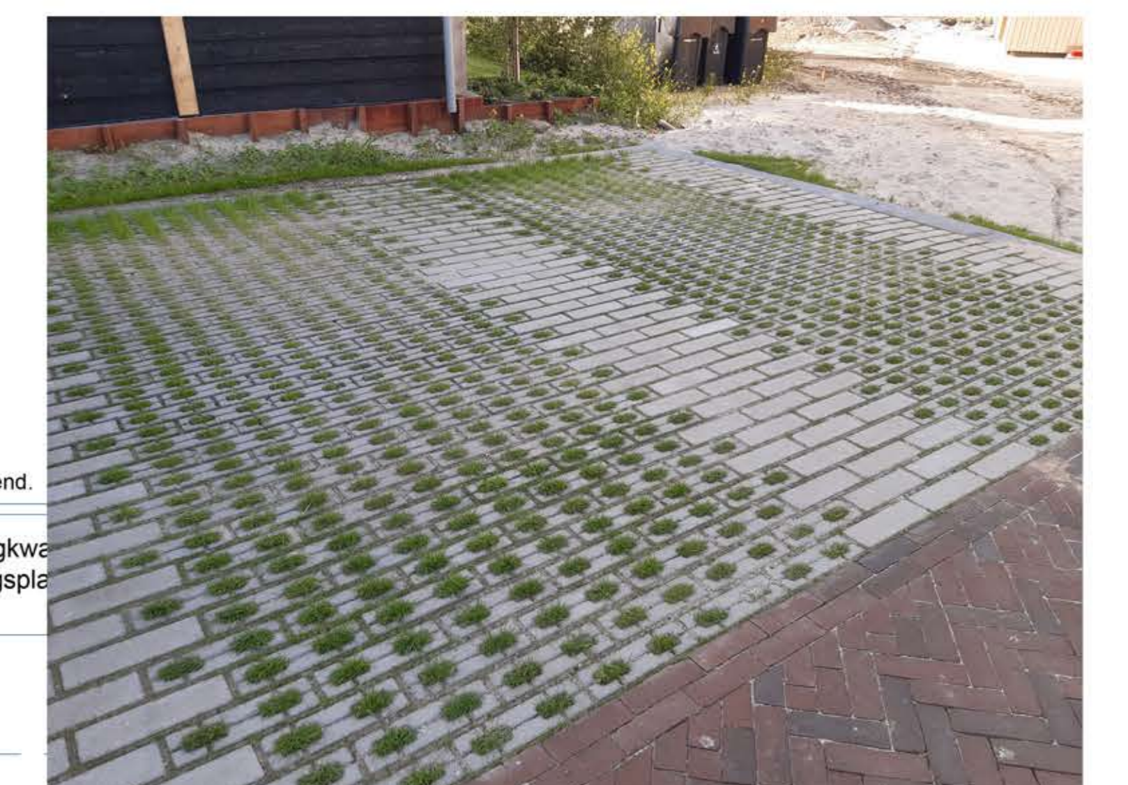
grasbetonstenen in de parkeervakken