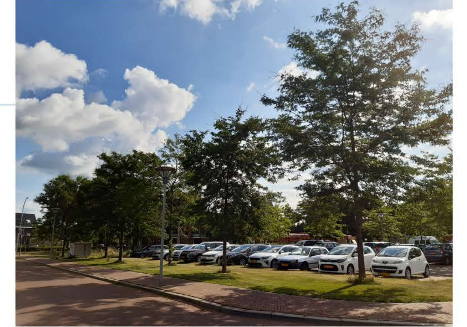
huidige Gleditsia's doorzetten