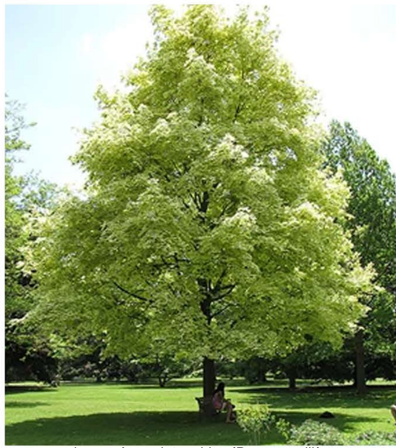
noorse esdoorn - Acer platanoides 'Drummondii'