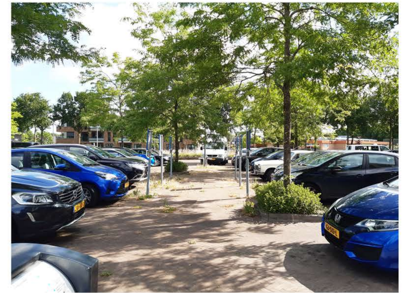
huidig parkeerterrein licht herinrichten en vakken voorzien van markering