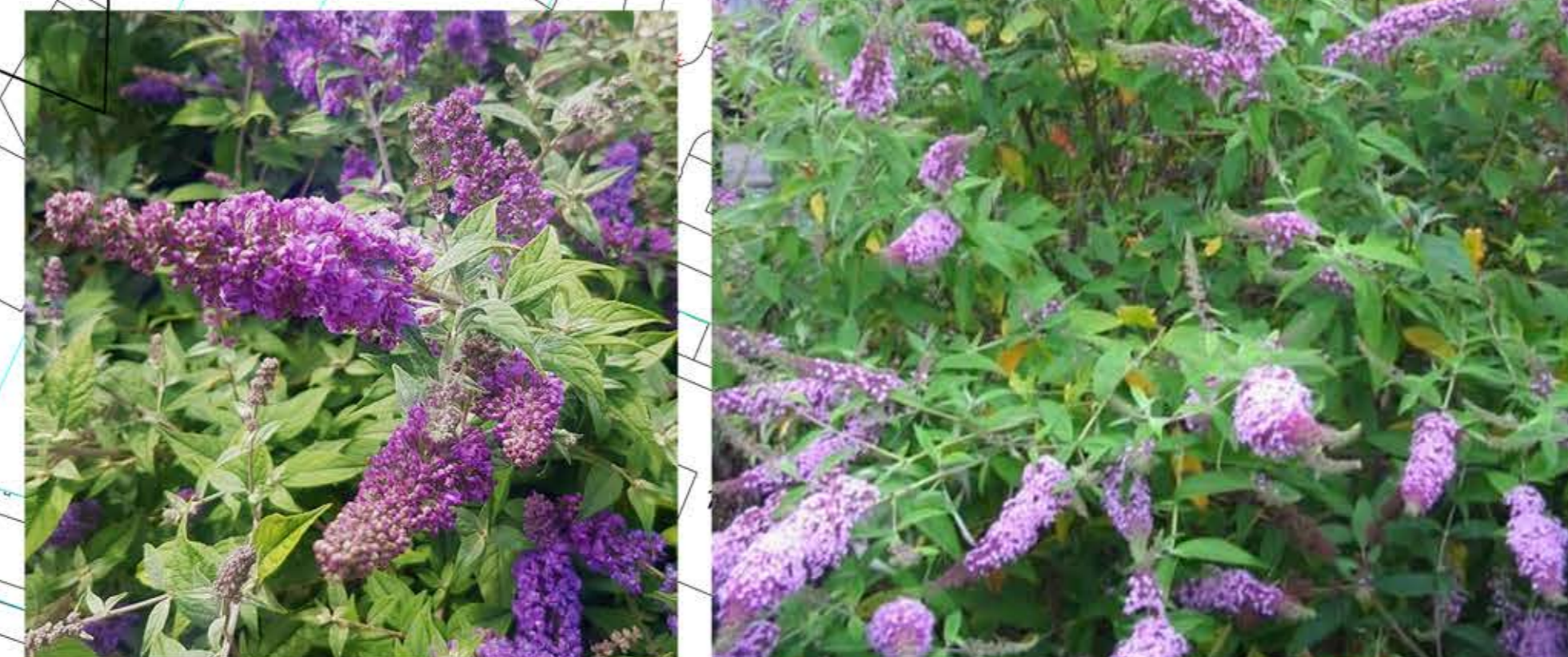
vlinderstruiken - Buddleja 's div kleuren als solitaire in het gras