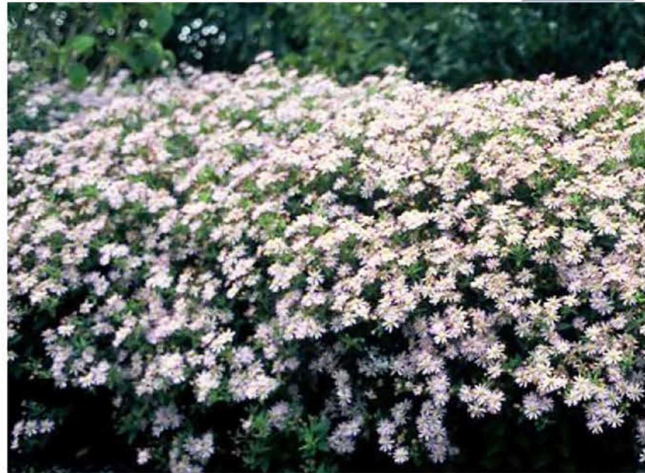
herfstaster - Aster ageratoides 'Asran' als onderbeplanting