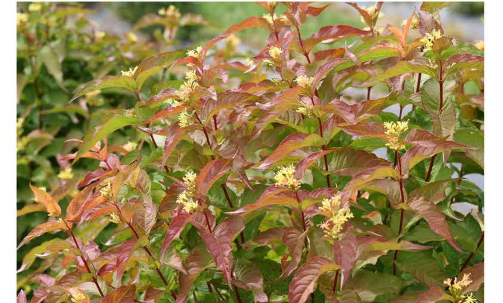
Diervilla splendens als onderbeplanting