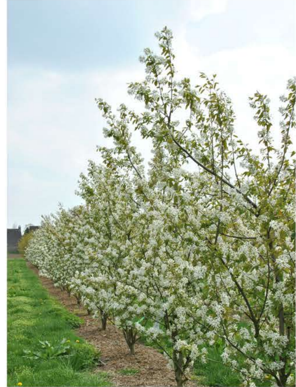
krentenboom - Amelanchier lamarckii als solitaire