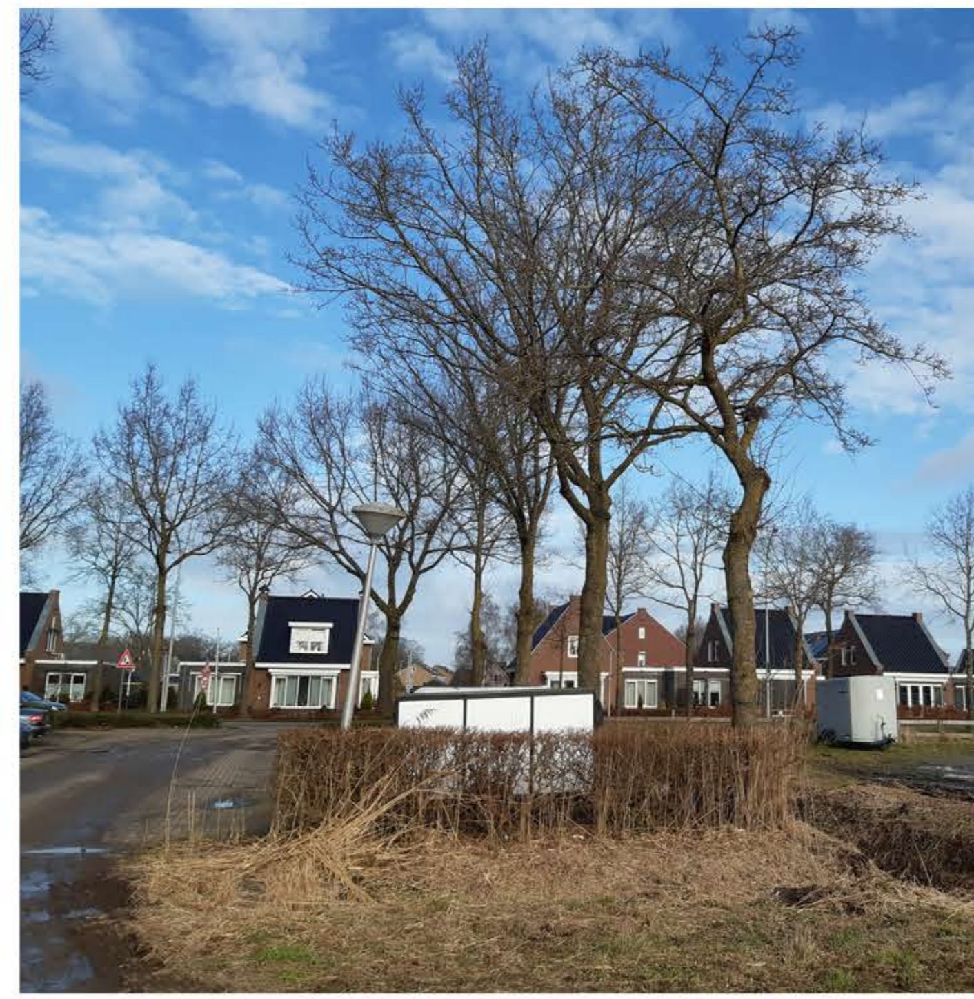
bestaande eiken en haag handhaven