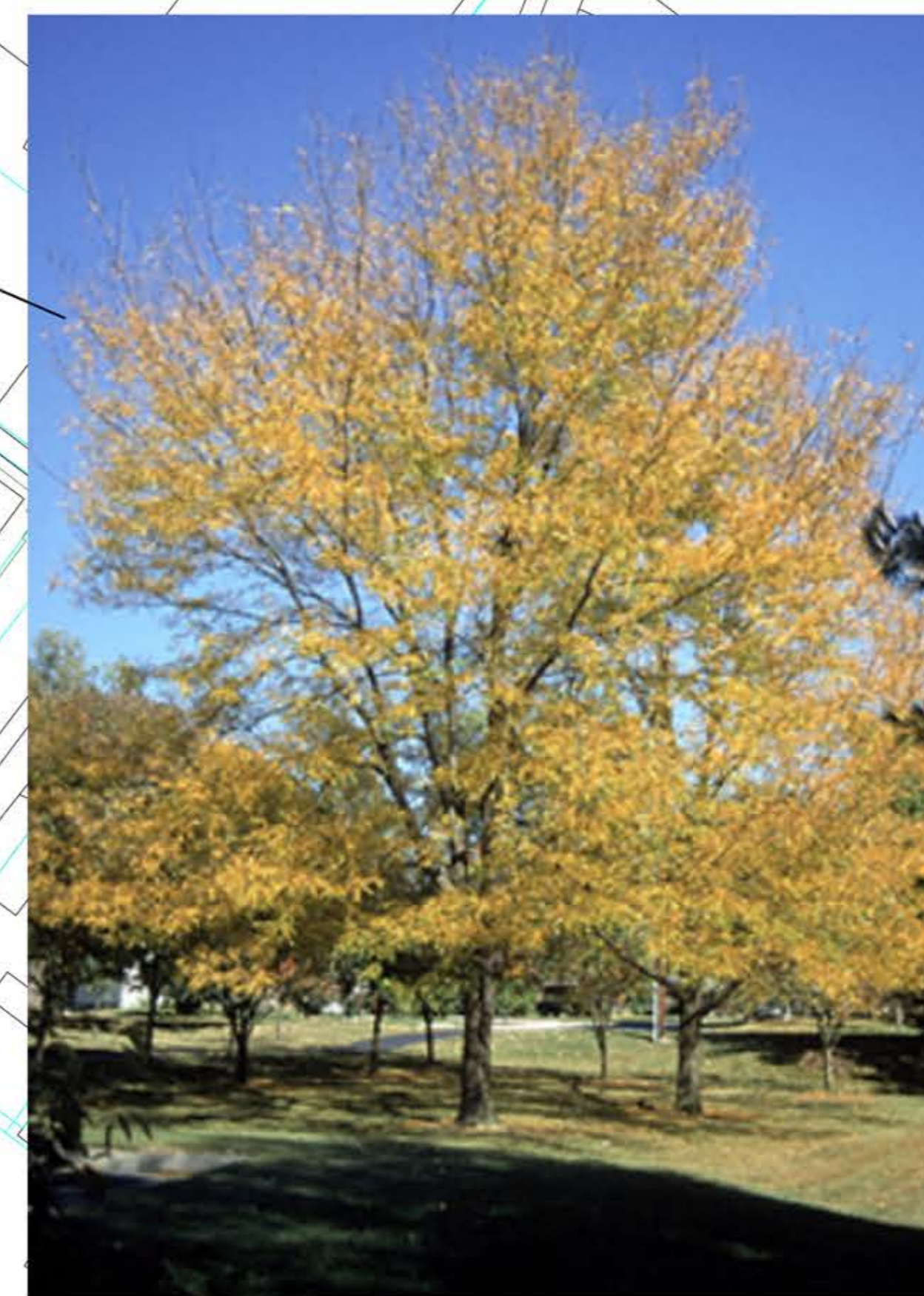
valse christusdoorn - Gleditsia triacanthos 'Imperial'

Aan deze tekening kunnen geen rechten worden ontleend.