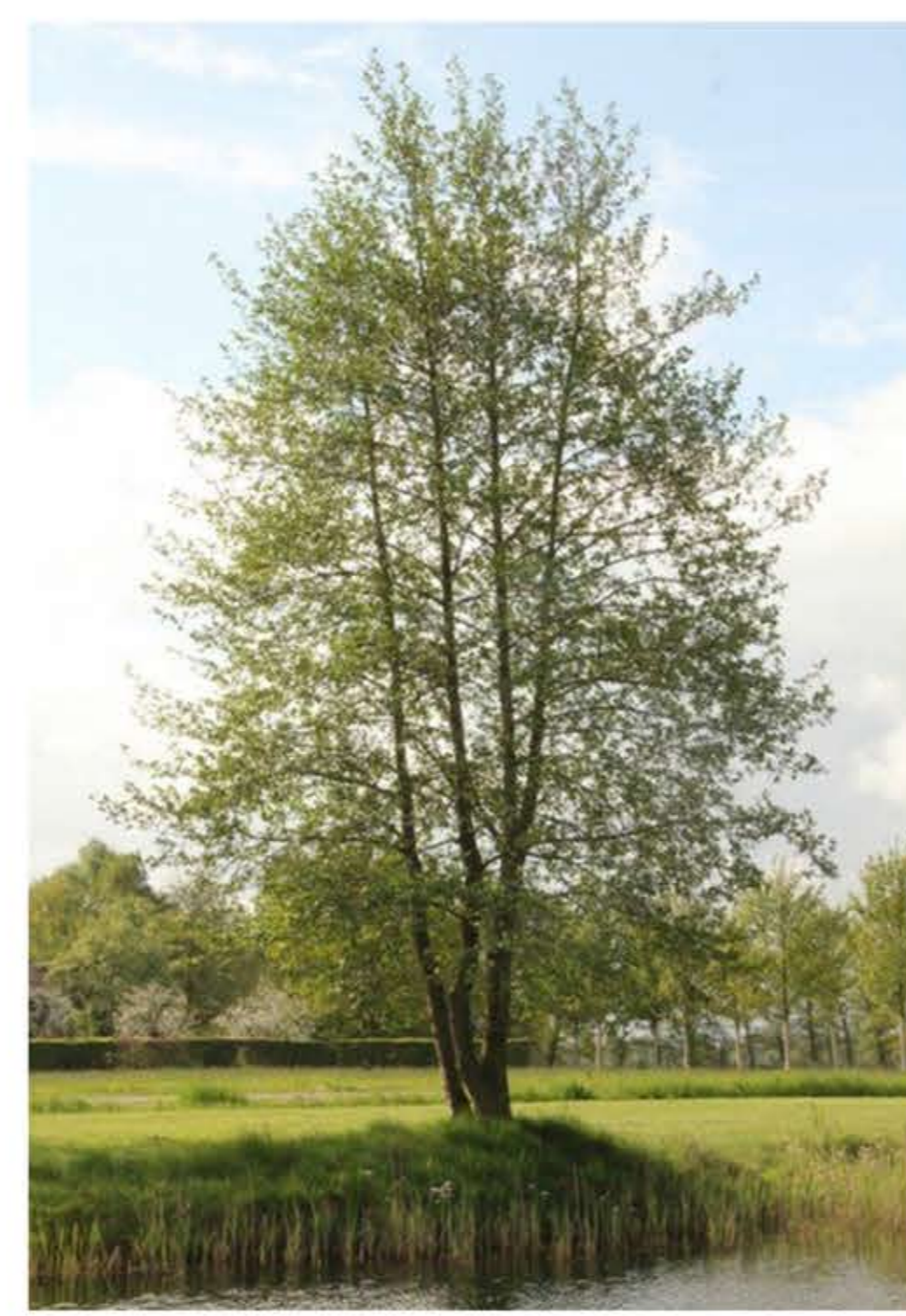
zwarte els / Alnus glutinosa