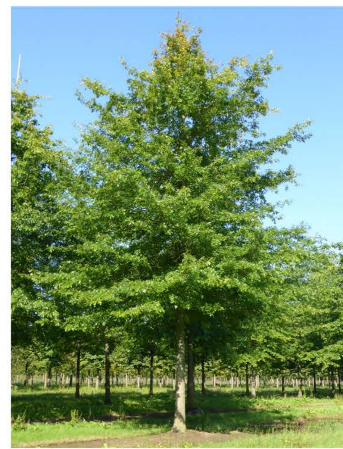
moereseik / Quercus palustris