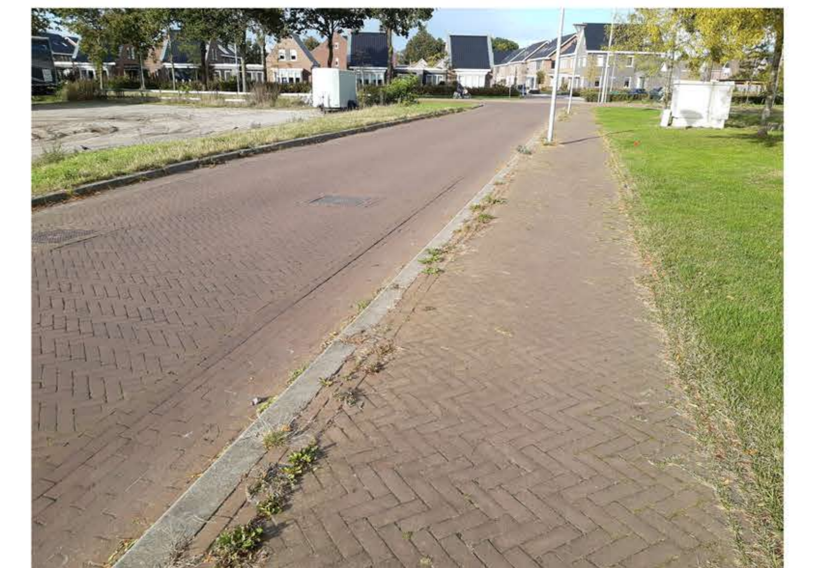
gebakken klinkers als huidige inrichting toepassen